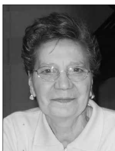
Marcella Bregoli in Marella 5° anniversario