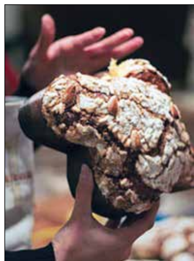
Buona Pasqua a tutti i lettori.

Una leggenda vuole che al Re Longobardo Alboino, durante l'assedio di Pavia (VI sec), offrirono in segno di pace un