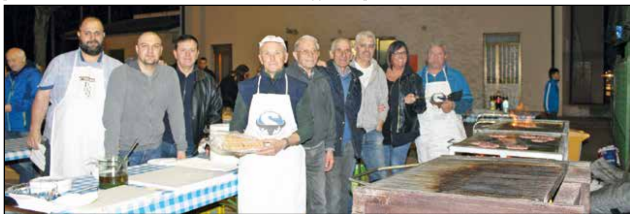
I volontari del Ritrovo Giovanile all'opera.