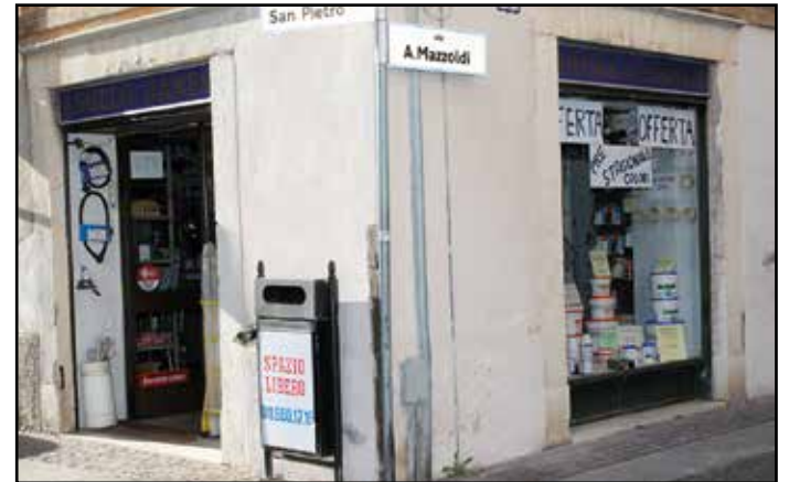
L'ingresso da via S. Pietro - Tel. 030.961202 - Montichiari.

SCONTO PARTICOLARE PER IL REPARTO COLORIFICIO